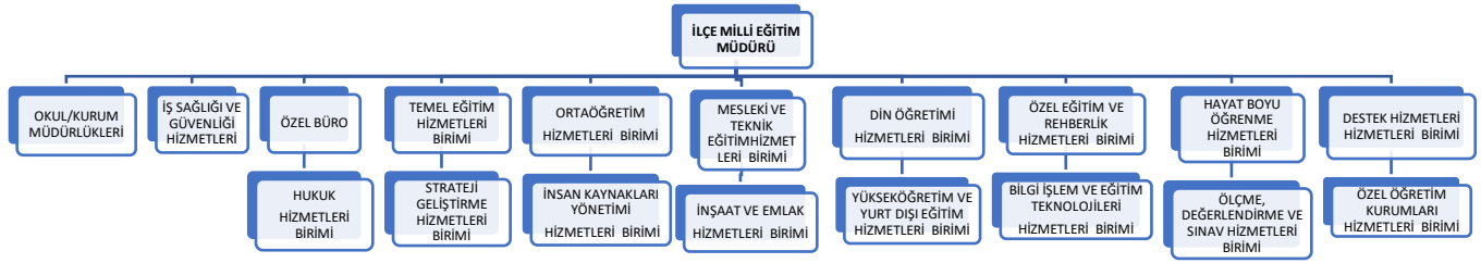
Şekil 4 - Datça İlçe Milli Eğitim Müdürlüğü Teşkilat Şeması

Datça İlçe Milli Eğitim Müdürlüğü okul, öğrenci, öğretmen ve yönetici sayıları aşağıdaki tablolarda verilmiştir.