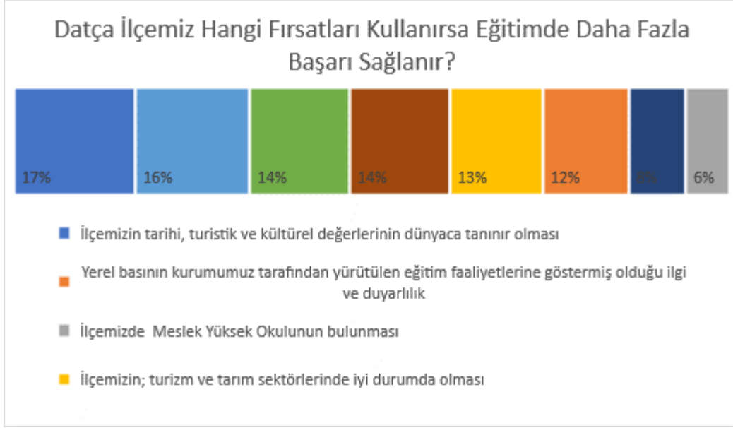
Şekil 2: Datça İlçemizin Fırsatları ile İlgili Paydaş Değerlendirmeleri

Başarılı bulunan alanlar: Öğrencilerin sosyal sportif sanatsal bilimsel ve kültürel faaliyetlere katılımı, belirli gün ve haftalarda yapılan programlar, zorunlu eğitim faaliyetleri (ilkokul ortaokul ve ortaöğretim), müdürlüğümüz faaliyetlerinin kamuoyuna tanıtılması, öğrenci başarısını artırmaya yönelik faaliyetler, E-Twinning projeleri ve Muğla İl Milli Eğitim Müdürlüğümüz tarafından eğitimi geliştirmek için uygulanan güzel projelere katılım sağlanması, İlçemiz okullarının hepsinde yeni nesil öğretmenler odası bulunması, ilçemizde 2 ilkokul, 2 ortaokul ve 2 liseimizde Tasarım ve Beceri Atölyeleri ile Görsel Sanatlar Atölyeleri ; 3 ilkokul, 4 ortaokul ve 3 liseimizde yeni nesil öğretmenler odası bulunması.