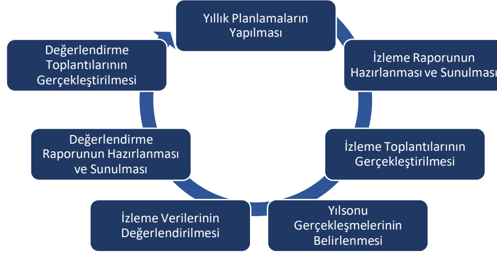
Şekil 6: İzleme ve Değerlendirme Süreci

İzleme ve değerlendirme sürecinin işleyişi ana hatları ile aşağıdaki şekilde özetlenmiştir.