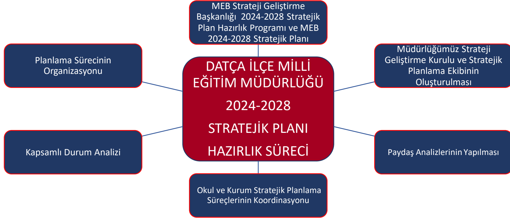
Şekil 1: Datça İlçe Milli Eğitim Müdürlüğü Stratejik Plan Hazırlık Süreci

Stratejik planlama uygulamalarının başarılı olması önemli ölçüde plan öncesi hazırlık çalışmalarının iyi planlanmış olmasına ve sürece katılımın üst düzeyde sağlanmasına bağlıdır. Hazırlık dönemindeki çalışmalar Bakanlığımız Strateji Geliştirme Başkanlığınca yayınlanan “ Millî Eğitim Bakanlığı 2024-2028 Stratejik Plan Hazırlık Programı ”na uygun olarak yürütülmüştür. Program aşağıdaki konuları içermektedir: